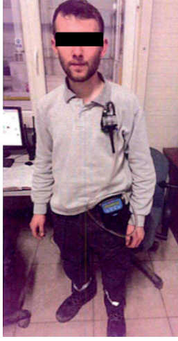
Şekil 2. Toza bağlı maruziyet ölçümleri

basıncı LUTRON firmasının PHB-318 modeli ile belirlenmiştir. Çalışanların toz maruziyetlerinin belirlenmesi esnasında alınan bir görünüm Şekil 2'de verilmiştir.